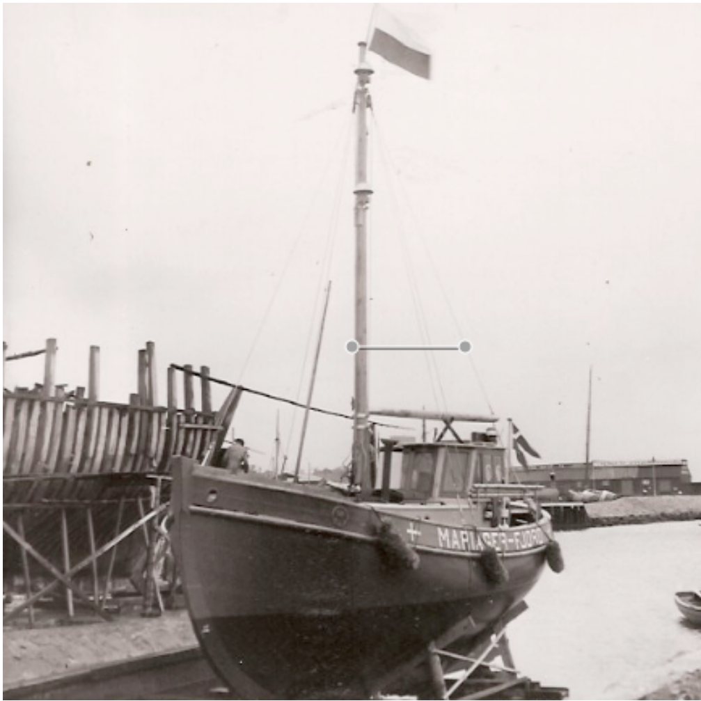
Her ses Mariager Lodseris lodsbåd "Mariager-Fjord" ved søsætningen i oktober 1942 på Holbæk Skibs- og Baadebyggeri i Holbæk