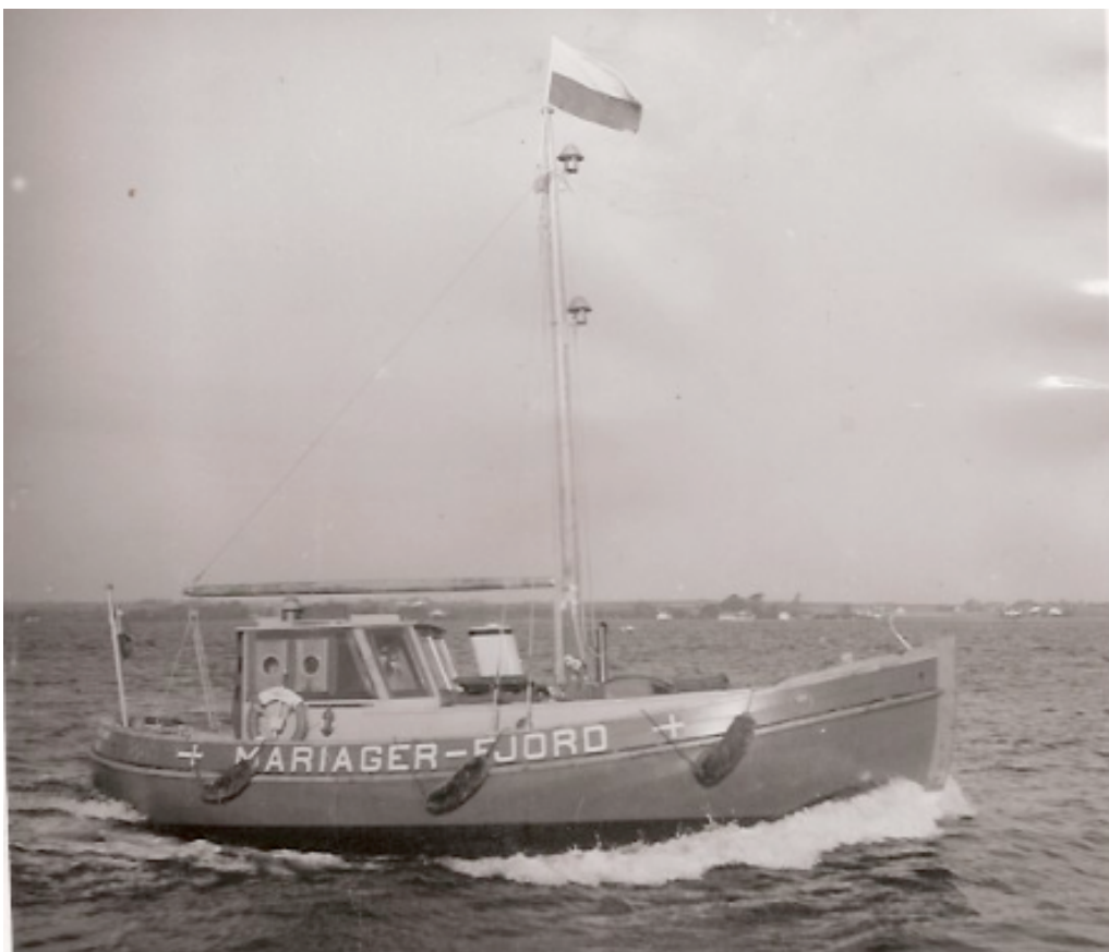
Her er Mariager-Fjord på jomfrurejsen fra Holbæk til Mariager.

Skrevet af Danmarks Lodsmuseumsforening.