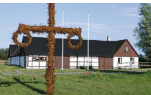
Dag Hammarskjölds historiske gård, Backåkra, Foto: Wikipedia.