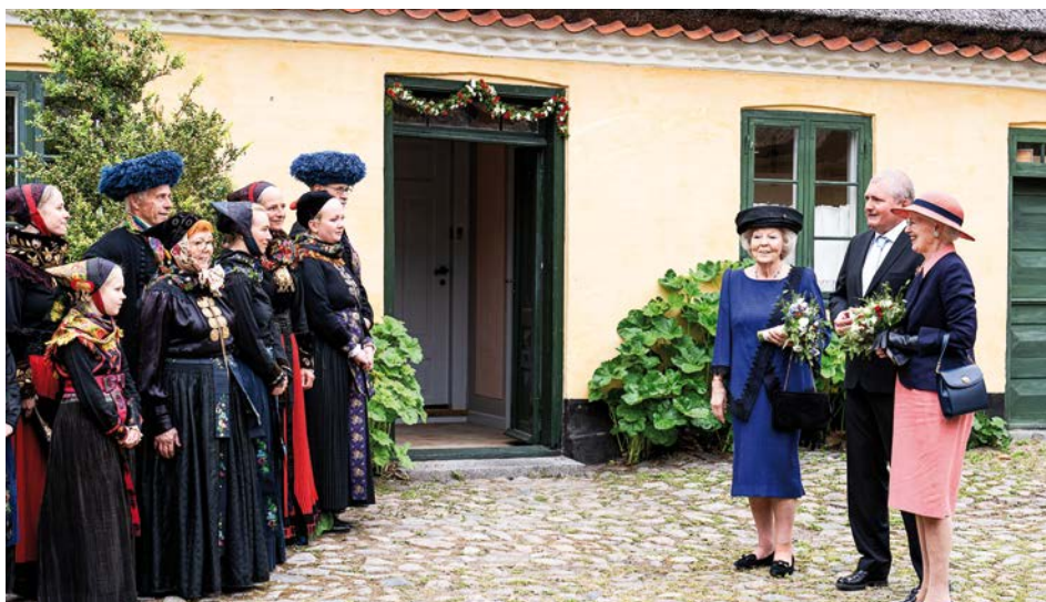
Dronningen og Prinsessen hilser på lokale i amagerdragter.

Derefter gik turen til Nordgårds storstue og derfra til den