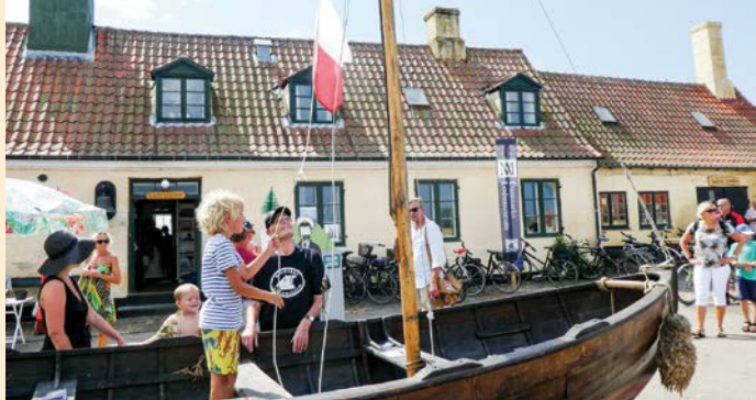
Lodsflaget hejses.