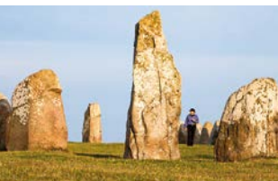
Ales Stenar.