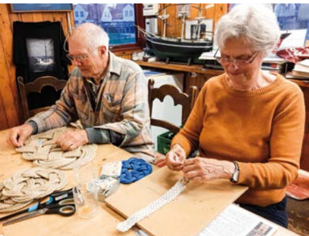
Der flettes sømandsmåtter.

Besøgende kan købe måtter, såvel som spækbrætter og bænke, lavet af de frivillige der har arbejdet vinteren igennem for museet.