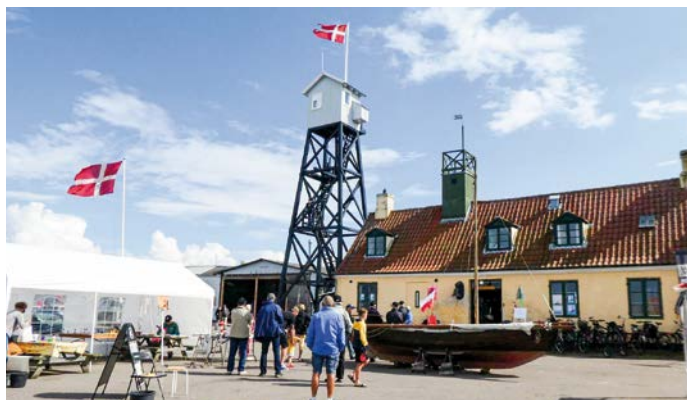
Havnepladsen er klar til Lodsens Dag. Privatfoto.