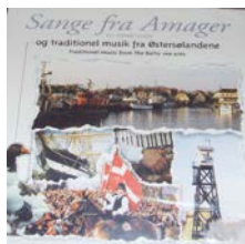
Cd med sange fra Amager.

Vi tror, at det bliver en fin eftermiddag for de 5–8-årige børn og deres forældre eller bedsteforældre.