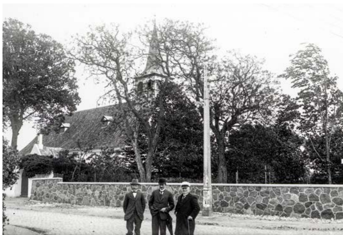
Store Magleby Kirke. Fotograferet af Paul Fischer. Foto: Københavns Bymuseum.