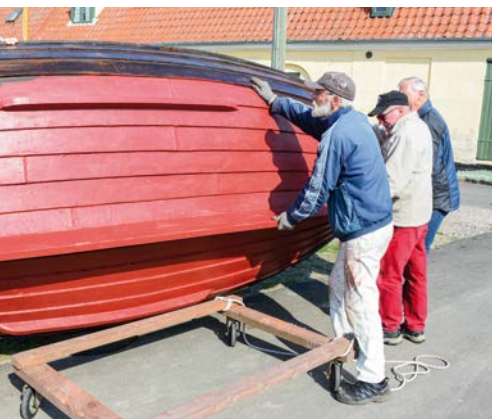
Mågen vendes.

I marts 2020 blev ansøgning til UNESCO underskrevet af de nordiske landes kulturministre. Ansøgningen omhandlede bygning, brugen og livet med de klinkbyggede både, der anerkendes som bevaringsværdig kulturarv.