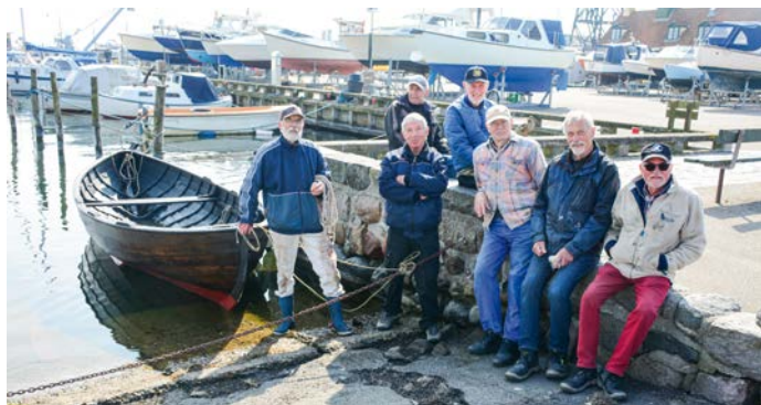
I vandet efter vinterly.

Store og små børn kan med en søfartsbog i hånden prøve maritime lærerige aktiviteter: Hejse lodsflaget på isbåden »Mågen«, lære at navigere, binde knob, lave en model af en lodsbåd, løfte et anker, gætte gamle sømandsudtryk, med mobilen søge svar på Danmarks lodshistorie, finde lodsens gebis og meget mere.