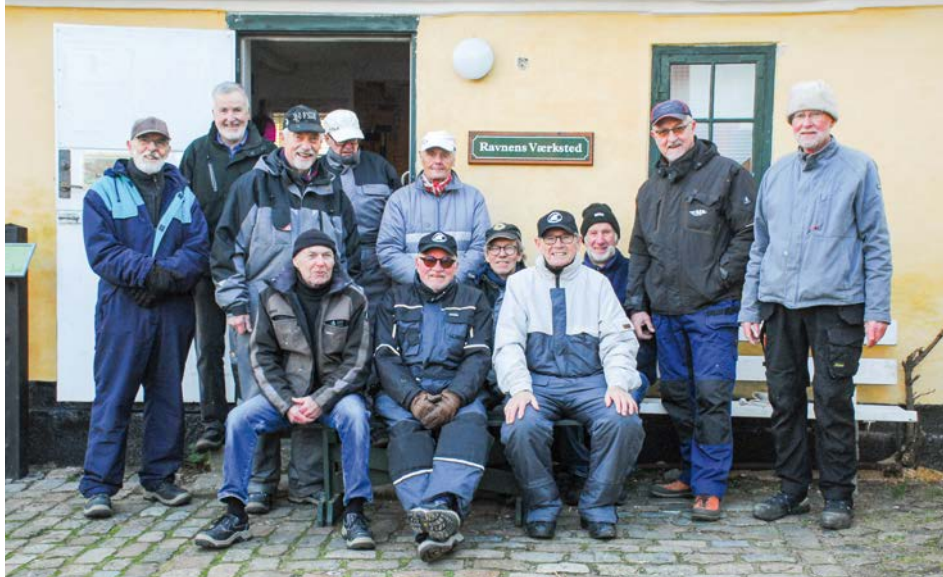
Ravnens frivillige. Privatfoto.