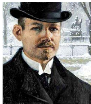
Paul Fischer: Selvportræt. 1909.