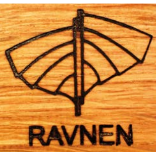
Logo for Ravnen. Privatfoto.

Det har også været naturligt for arbejdsgruppens medlemmer at påtage sig vedligeholdelsesarbejder på Danmarks Lodsmuseum, bl.a. kalkning af museet samt renovering og maling af vinduerne på museets sydfacade.