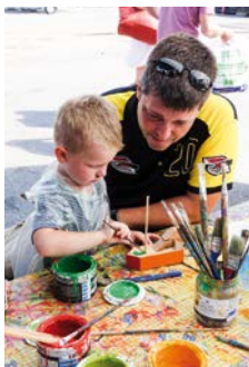
Der arbejdes koncentreret.

På havnepladsen foran lodsmuseet kan børn og voksne blive kloge på lodsens spændende verden, og gæsterne kan besøge den stemningsfulde og autentiske tidslomme fra 1984, der har været lodsernes gamle arbejdsplads siden 1823.