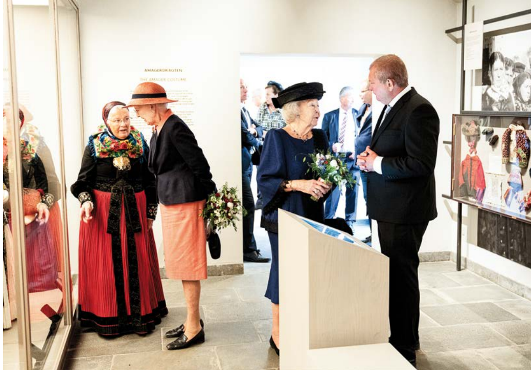
Fra dragtstillingen.