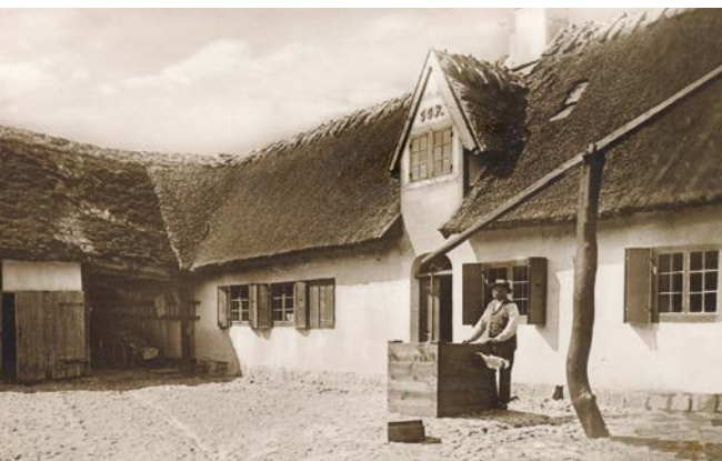
Den Gamle Museumsgård 1922.

Vi har planer og tanker om, at vi skal have en dag, hvor vi