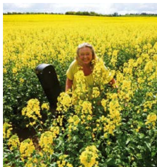
Benedikte Riis.