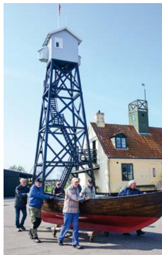
På vej i vandet.